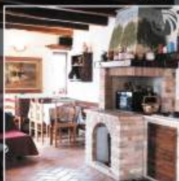
2) Nostra Appartamento